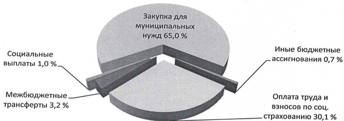
Рис. 3. Экономическая структура расходов бюджета Приволжского сельского поселения за I полугодие 2023 года

Экономическая структура расходов бюджета поселения характеризуется следующими показателями (рисунок 3).