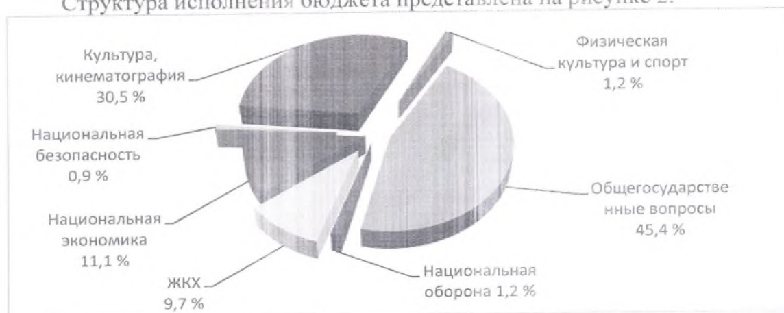
Рис. 2. Структура исполнения бюджета Приволжского сельского поселения за I квартал 2021 года

Структура исполнения бюджета представлена на рисунке 2.